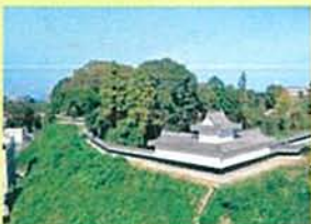
水戸城二の丸角櫓 (2021復元)